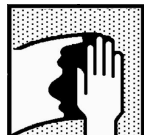
Обезжириватель Dynacoat Uni Degreaser